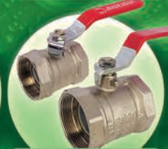
Válvulas de Bola de Bronce de 2" y 3"