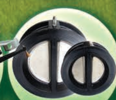
Válvulas Check de Hierro 2" hasta 16"