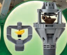
Rotadores Nelson™ de 1/2" y 3/4"