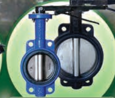
Válvulas Mariposas de Hierro 2" hasta 24"