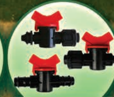
Mini-Válvulas para Cinta de Goteo