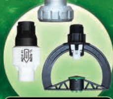
Accesorios para Pivote Marca Senninger®