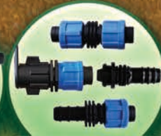
Conectores para Cinta de 5/8" y 7/8"