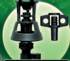
Xcel Wobbler Marca Senninger®