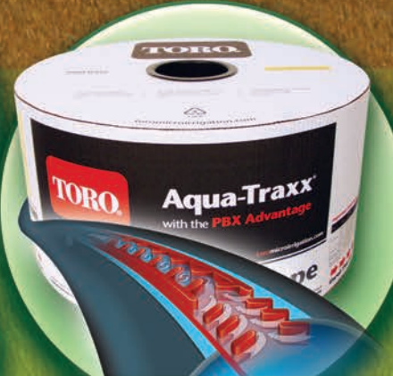
Cinta de Goteo Toro® Aqua-Traxx