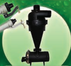
Hidrociclón 2" y 3" de plástico reforzado