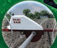
Wade Rain Sideroll Linea Rodante - hasta 500 mts