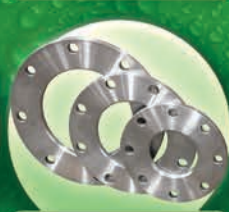
Bridas de Acero de 3" hasta 18"