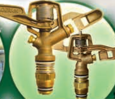
Aspersores de Bronce Círculo Completo y Parcial