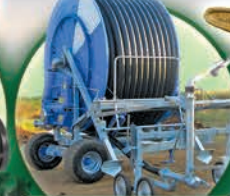
Cañon Viajero en 4" y 5" x 400 mts