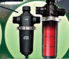
Filtros de Discos de 2" y 3" y hasta 50 CBM