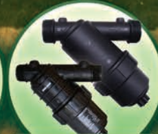
Filtros de Malla 120 Mesh - 2", 1.5", 1", 3/4"