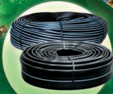
Manguera Toro® Oval y Redondo