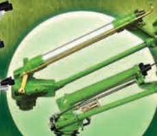
Cañones SIME Tipo Engrane - 1.5", 2", 3"