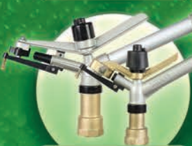
Cañones de Impacto Marca SIME