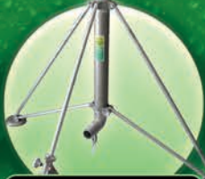
Tripies de Aluminio 1.5 y 2 metros