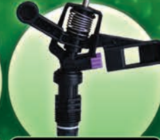
Aspersor de 1/2" Plástico y Angulo Bajo