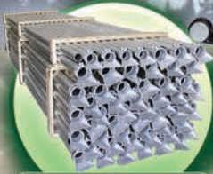
Tubo de Aluminio 3" y 4", 6.10 y 9.15 metros