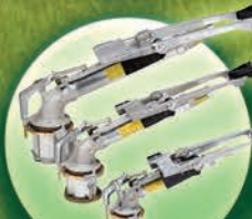
Cañones Nelson Círculo Completo y Parcial