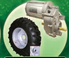
Partes para Pivotes Motores, Masas, y Llantas