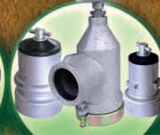
Válvulas Abridoras e Hidrantes de Aluminio