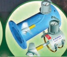
Medidores de Flujo McCrometer 2" hasta 36"