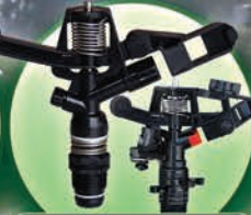
Aspersores de Plástico Círculo Completo y Parcial