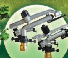
Mini-Cañones Círculo Parcial 1.25"- 1.5"