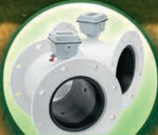
Medidores Magnéticos Seametrics 4"- 10"