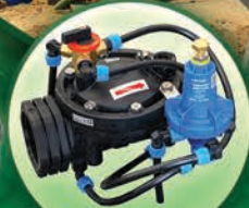
Válvulas de Control Reguladores de Presión