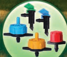
Góteros Tipo PC, Ajustable, y Bandera