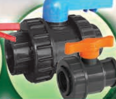
Válvula de Bola de PVC, 1", 2" y 3"