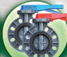
Válvulas Mariposa de PVC de 3", 4" y 6"