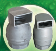
Válvulas de Aire de Aluminio 2", 3" y 4"