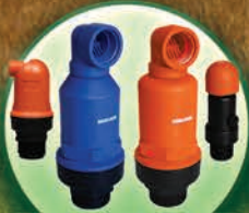
Válvulas de Aire de Plástico Sencillo y Continuo