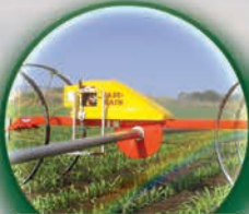
Wade Rain Powerroll Línea Rodante - hasta 500 mts