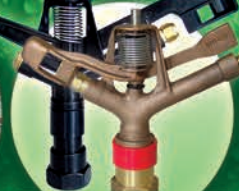
Aspersores de 1" en Bronce y Plástico