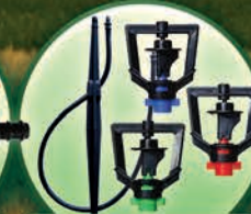
Micro Aspersores con Estaca de 30-40cm