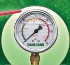
Manómetros de Glicerina