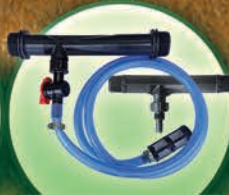
Inyectores Venturis de 3/4", 1", 1.5", y 2"