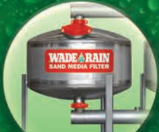
Filtro de Grava y Arena Ollas de 36" y 48"