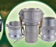
Acoples Camlocks de Aluminio - 2", 3", y 4"