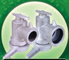
Valvas Abridoras 2" x 3" y 3" x 3" Tipo Diente